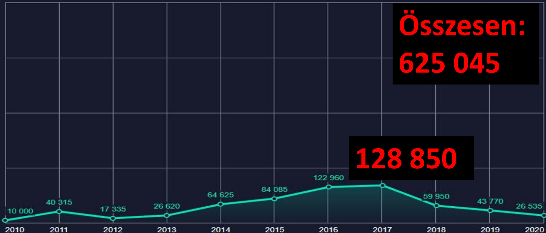
A MENEDÉKJOGI KÉRELMEK SZÁMÁNAK ALAKULÁSA