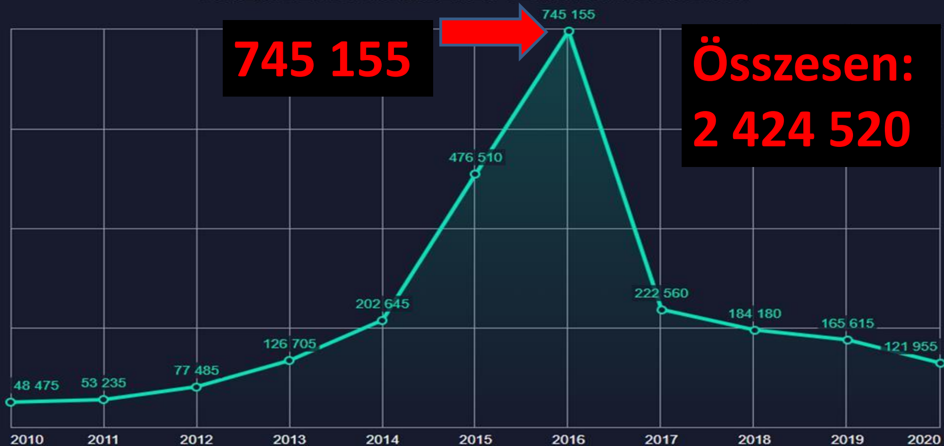
A MENEDÉKJOGI KÉRELMEK SZÁMÁNAK ALAKULÁSA