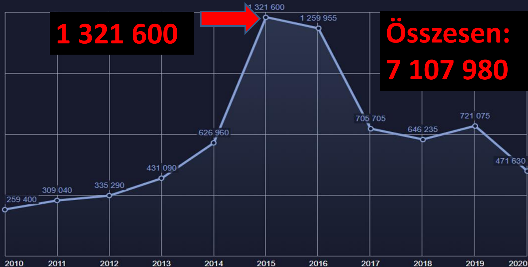
A MENEDÉKJOGI KÉRELMEK SZÁMÁNAK ALAKULÁSA